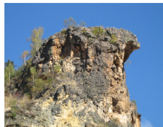
(Rosia Montana. Piatra Corbului)

Detunatele, Piatra Corbului, Piatra Despicata, Poiana Narciselor, Cheile Cibului, sunt doar cateva dintre monumentele naturale ale zonei. Din pacate se afla in locuri greu accesibile, nu exista marcaje, drumuri de acces.