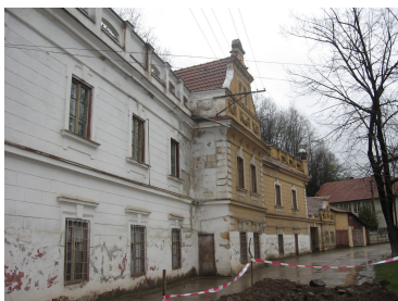
(Zlatna. Casa de cultura)

Zestrea localitatilor miniere din judetul Alba in ce priveste cladirile de patrimoniu este bogata si asta datorita faptului ca activitatile miniere de aici sunt din cele mai vechi timpuri. Exploatarea aurului in aceasta zona a creat in trecut centre importante: Abrud, Zlatna, Rosia Montana.