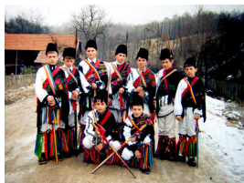
(Almasu Mare. Calusarii)